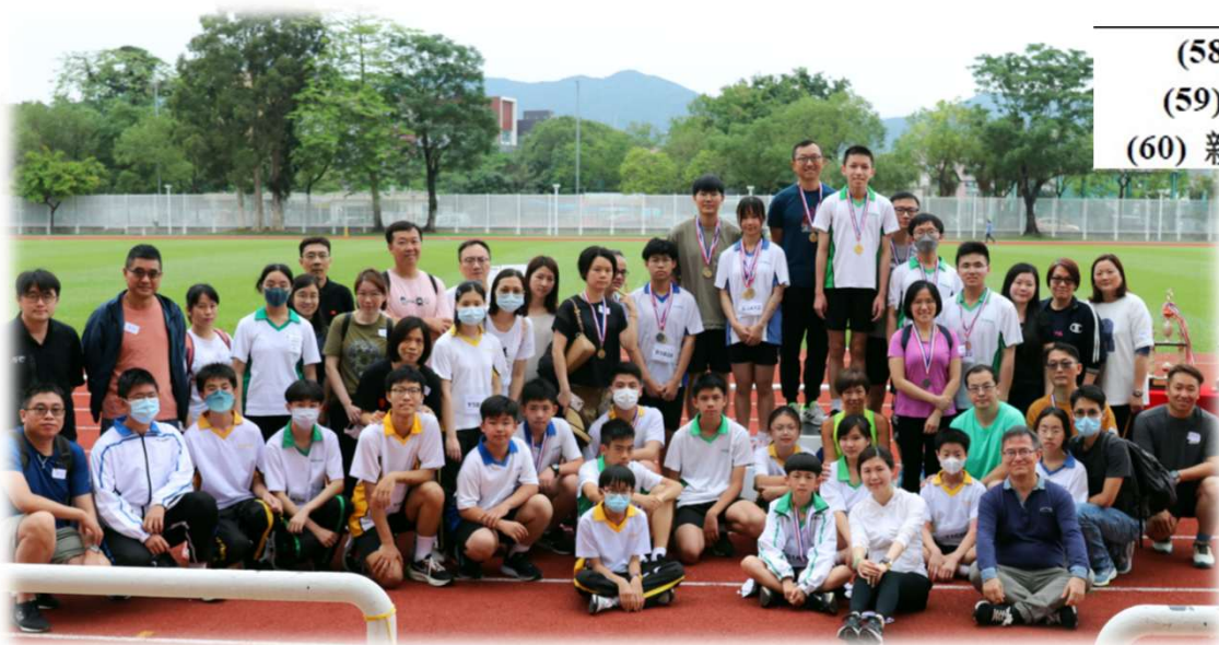
(58) 親子女子 2 x 50m 接力賽(決) (59) 親子男子 2 x 50m 接力賽(2 決) (60) 親子男女混合 2 x 50m 接力賽(2 決)