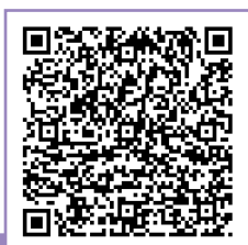
教育局網頁 「與法團校董會運作相關的法例規定 — 扼要提示」

與法團校董會運作和校董選舉相關的法例規定，請參閱教育局網頁「 與法團校董會運作相關的法例規定—扼要提示 」及《教育條例》第 III B 部。