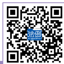
《教育條例》第 III B 部